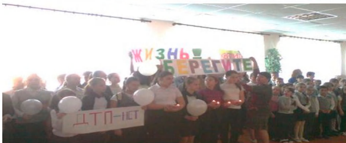
Линейка «Внимание – зимняя дорога»