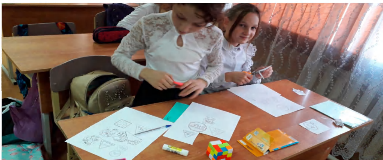
ЛОТО по ПДД