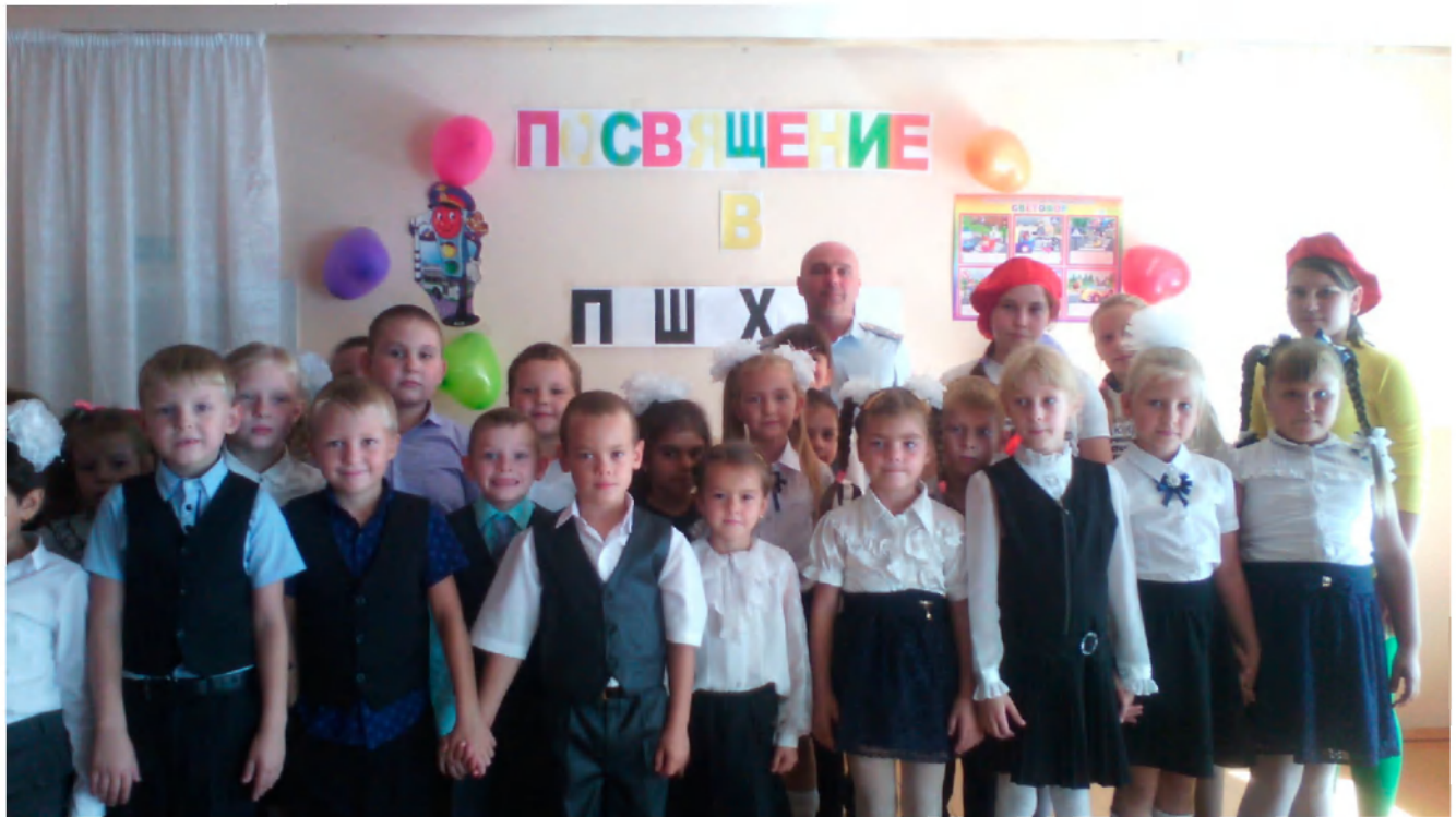
Рейд членов ЮИД к ребятам в летний оздоровительный лагерь.