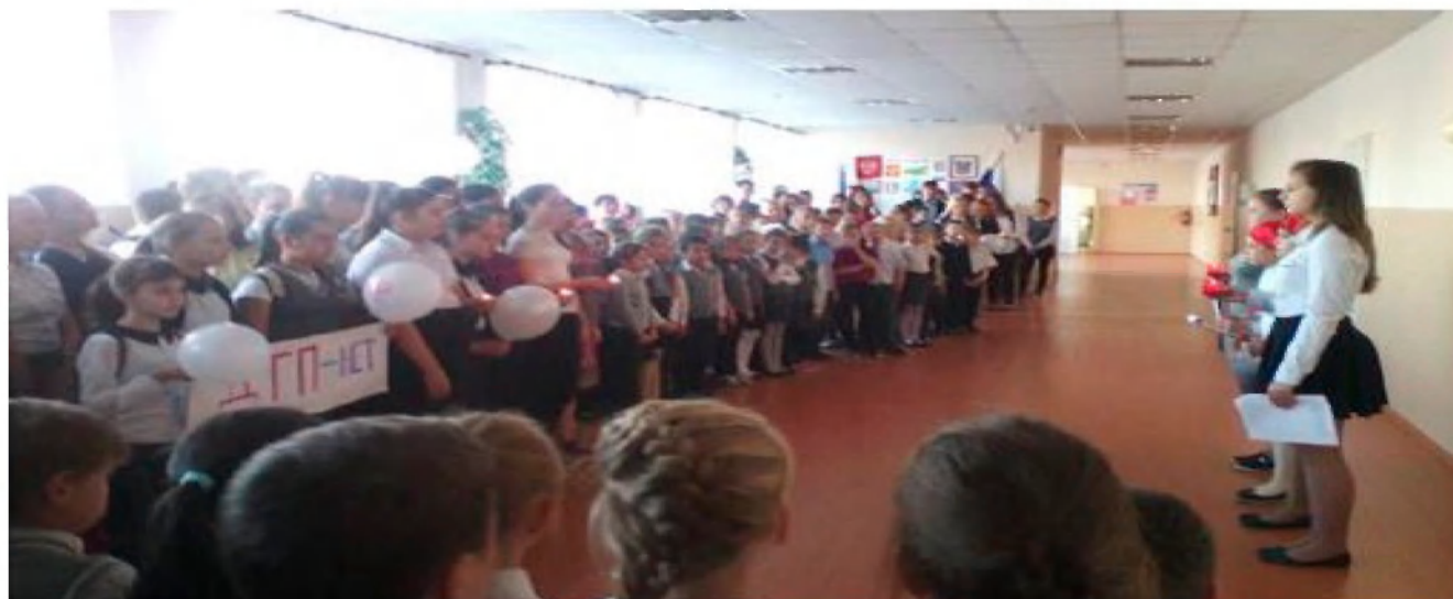
Линейка, посвященная Памяти жертв ДТП.